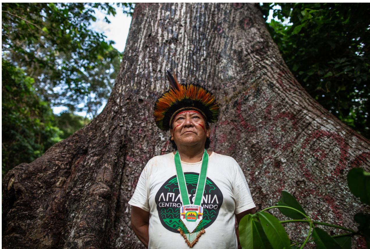
Davi Kopenawa från Yanomami-folket i Brasilien.

Till följd av denna panel gick Amazon Watch Sverige med i nätverket Schyssta Pensioner för att kunna stödja det påverkningsarbete som försöker få AP-fonderna att sluta investera i ohållbara projekt.