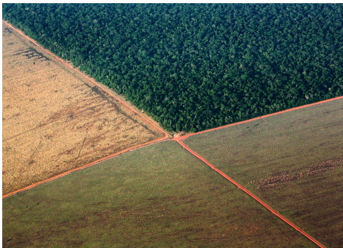
Gränsen mellan Amazonas regnskog och mark förberedd för att odla sojabönor i västra Brasilien.